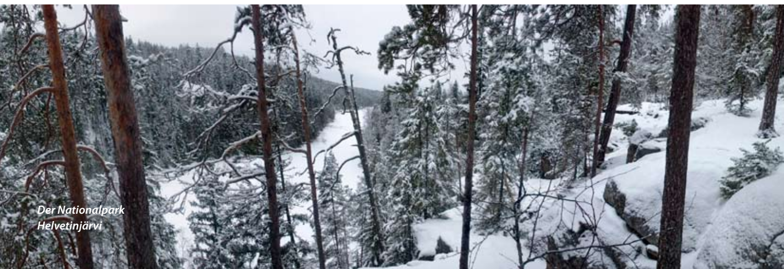
Der Nationalpark Helvetinjärvi