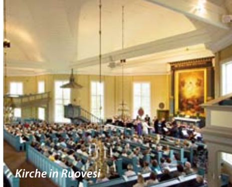
Kirche in Ruovesi