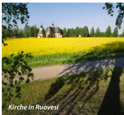
Kirche in Ruovesi