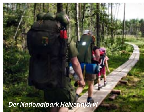
Der Nationalpark Helvetinjärvi