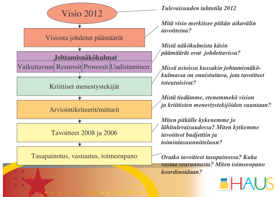
KUVA 1. Ruoveden strategian rakenne.

Kullekin kriittiselle menestystekijälle asetetaan arviointikriteerit, joiden avulla tiedetään, edetäänkö strategian toteuttamisessa vision ja strategisten päämäärien suuntaan. Kriittiset menestystekijät täsmennetään johdettaviksi asioiksi laadullisilla tai määrällisillä arviointikriteereillä. Edelleen kullekin arviointikriteerille asetetaan strategiassa tavoitetasot ja/tai toimenpiteet valtuustokaudelle ja seuraavalle vuodelle. Tavoitetaso kytkee tavoitteet budjettiin ja toimintasuunnitteluun.